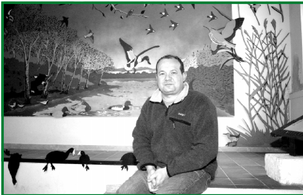
Repositori s'Albufera- dieiperello.com

-No, de cap manera, no hi està, de cap manera. Quan tot d'una es va començar a fer aquest parc, l'any 88, hi havia una mica de discrepància, perquè hi havia projectes d'urbanització que, pel fet de la declaració d'aquest parc, es varen aturar. Però, amb el temps i amb la feina, ara estic segur que cap, cap hotel de la zona, no voldria que no hi fos. S'Albufera suposa, jo crec, un punt de qualitat per a la Badia d'Alcúdia, un punt de qualitat per a la Platja de Muro. És un referent a tots els hotels. Molts d'hotels, a vegades estiren o avancen un poquet la temporada pel